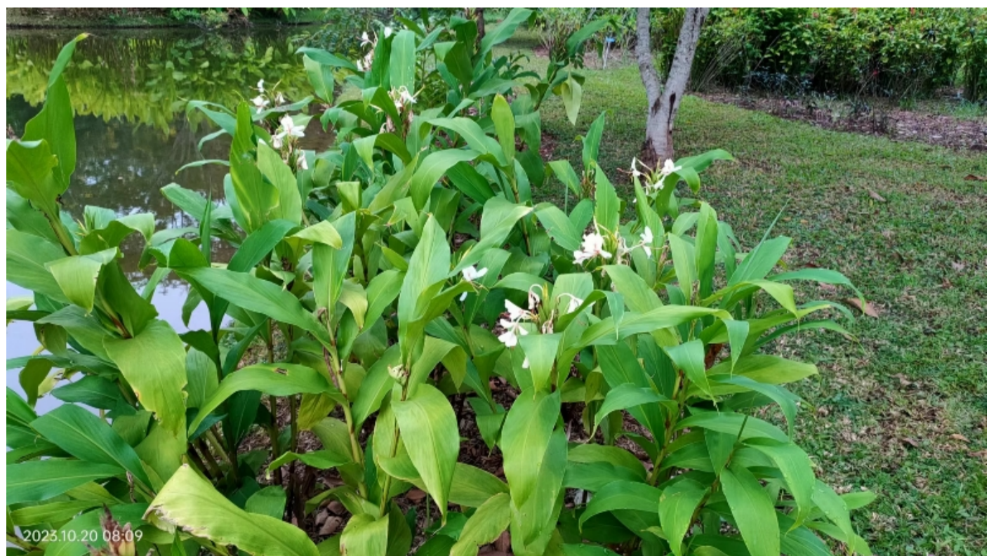
定植于百花园正在开花的‘荣耀’姜花

姜花新品种具有较强的生长势、高雅的花形态、馥郁的香气、较长的花期以及全年不休眠等优点, 非常适合作为园林应用型品种。定植于百花园的姜花新品种生长旺盛且持续开花, 表明适合在版纳地区栽培。未来园林园艺中心将通过组织培养以及分割根茎繁殖获得大量的种苗, 定植在版纳植物园不同区域, 形成优美的景观效果。此外, 西双版纳地区的傣族妇女喜欢将白姜花、黄姜花以及黄白姜花作为头饰, 既美观又香气四溢, 但目前由于森林退化, 野生的姜花资源已经急剧减少, 因此也期望能够扩繁出更多的种苗与当地百姓共享, 装扮庭院, 妆点美丽。