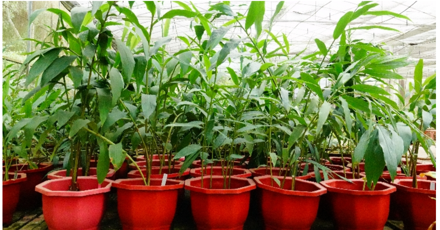
正在苗圃中保育的系列获赠姜花品种