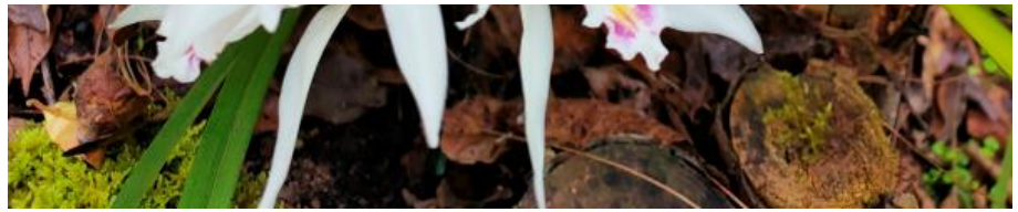
花朵雪白如云的大雪兰