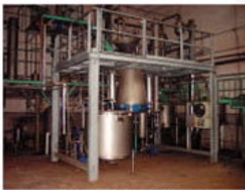
图1为100L立式沙棘有效生物成分提取设备。该设备由不锈钢制成,结构紧凑,操作方便,适用于实验室和小型生产。

引进了沙棘有效生物成分提取技术和设备,经消化吸收创新,生产出国产黄酮萃取设备,国产化率达到70%以上。沙棘经深加工,提取出黄酮,制成的沙棘保健食品和饮料,深受消费者青睐。