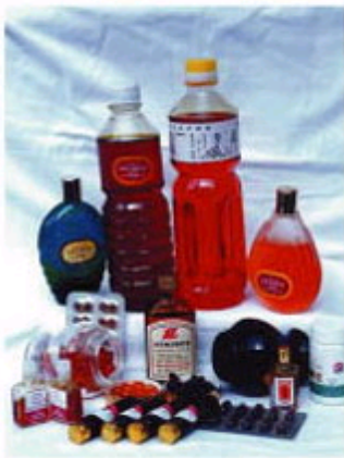
沙棘保健食品和饮料