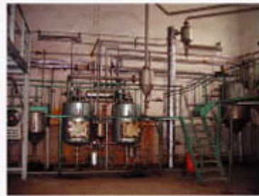
图2为沙棘有效生物成分提取设备。该设备由不锈钢制成,结构紧凑,操作方便,适用于实验室和小型生产。