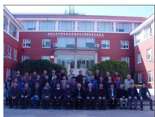
国重室第三届第四次学术...