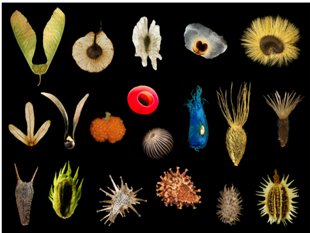
图1 种子/果实的多样性