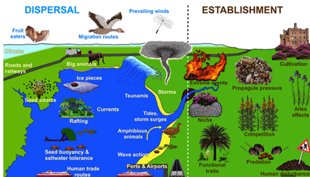
图2 植物长距离扩散的主要阶段及制约因素