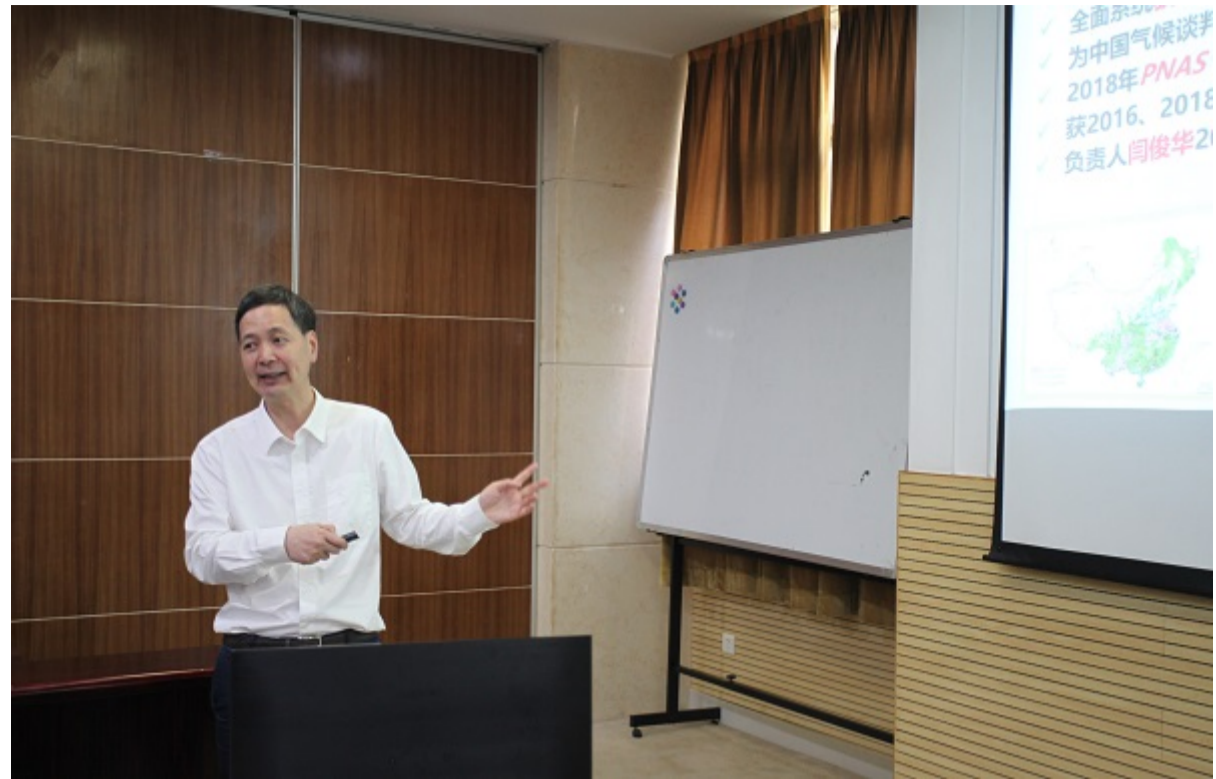
任海作华南植物园工作进展报告