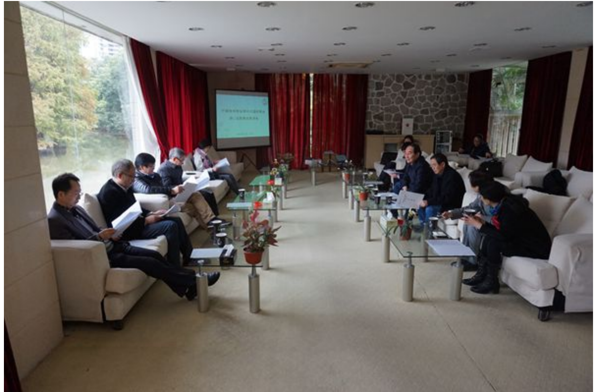
第2次理事长联席会在中科院华南植物园召开