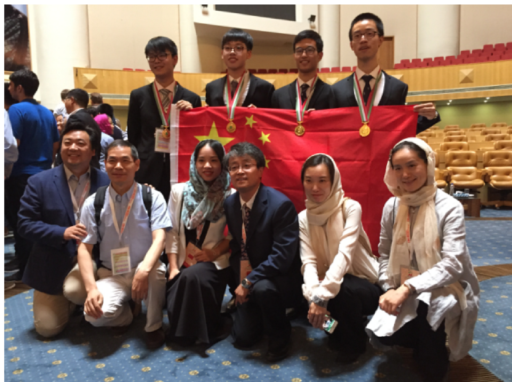
颁奖后我国代表团集体与国旗合影