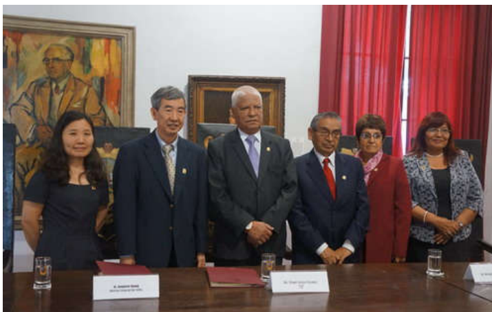
双方代表在圣马可斯大学旧址进行预签仪式