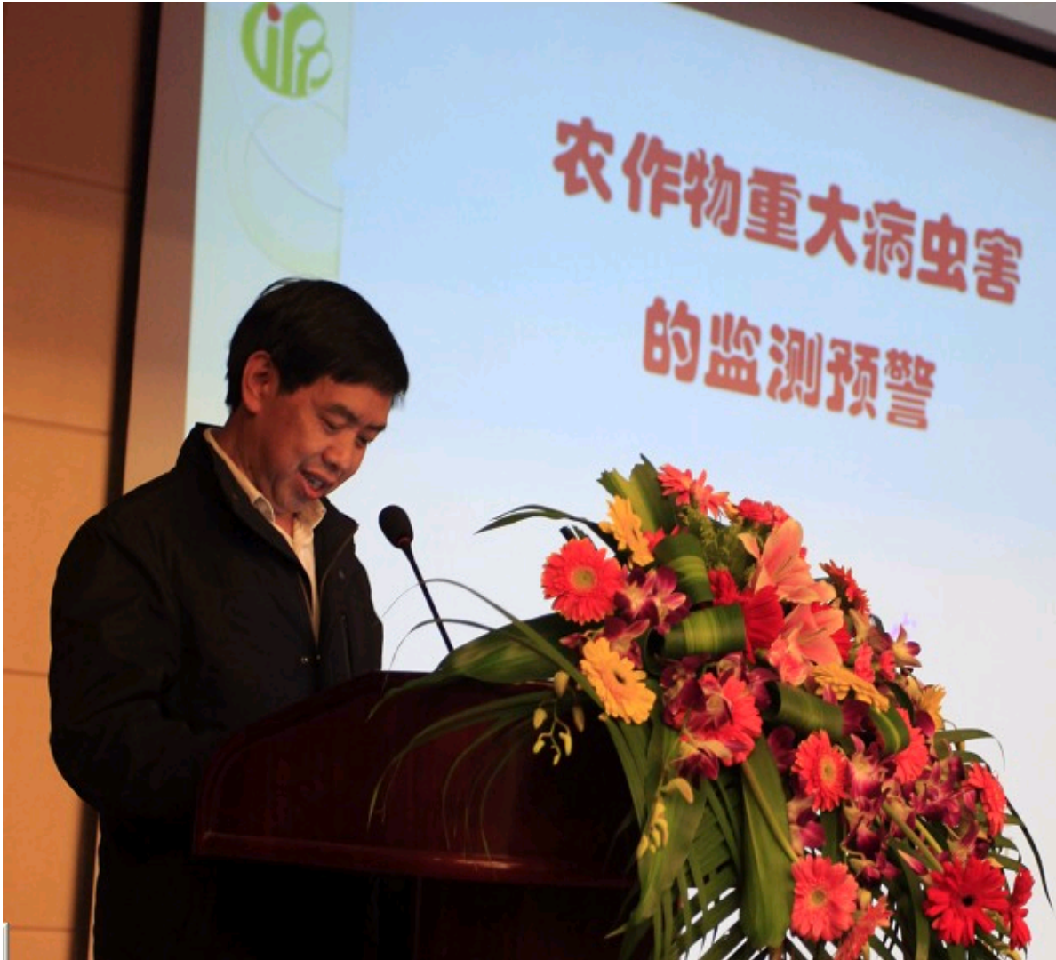
中国农科院植保所程登发研究员做报告