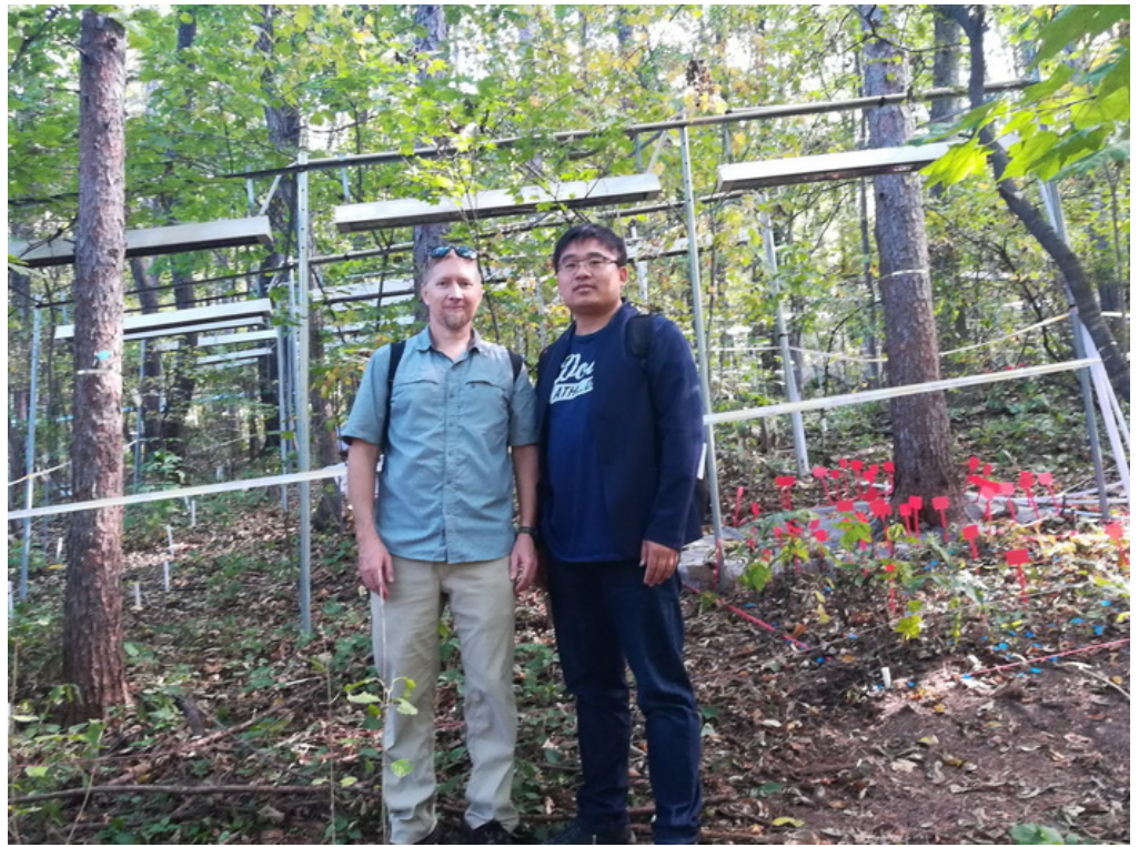
考察清原站增温试验平台