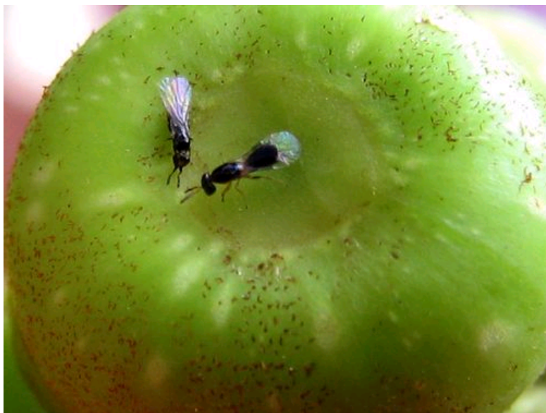
钝叶榕果实与榕小蜂