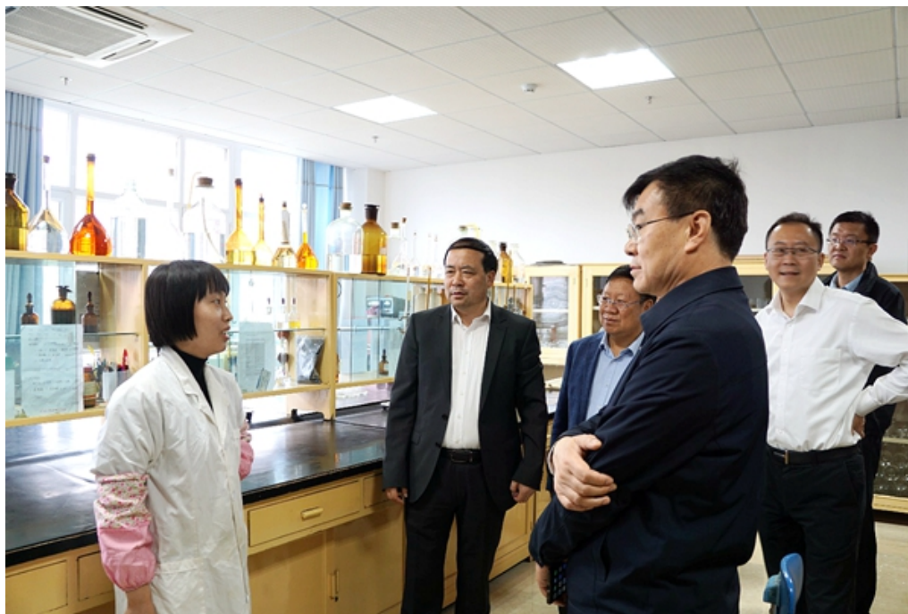
考察中心实验室建设