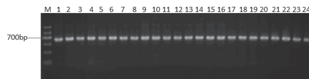
图 2 引物 pstS1/pstS2 扩增部分烟草青枯病菌的产物电泳图