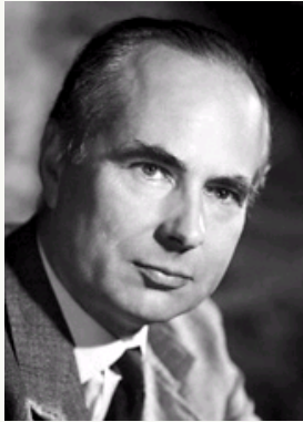
安德鲁·赫胥黎

剑桥大学三一学院近日发布公告称, 该院前院长、1963年诺贝尔生理学或医学奖得主安德鲁·赫胥黎 (Andrew Huxley) 于5月30日逝世, 享年94岁。