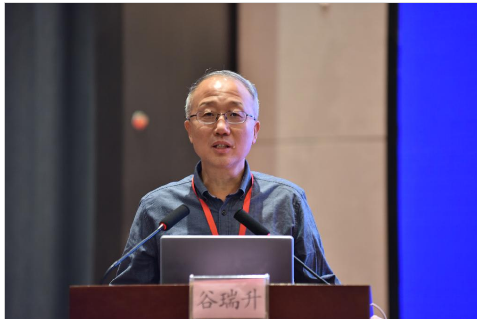
中国细胞生物学学会理事长陈晔光院士、国家自然科学基金委员会副主任谷瑞升，山东第一医科大学（山东省医学科学院）副校（院）长赵家军、彭春雷、刘思金出席开幕式。