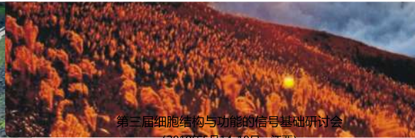
第三届细胞结构与功能的信号基础研讨会