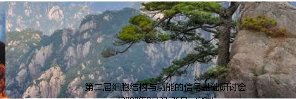
第二届细胞结构与功能的信号基础研讨会