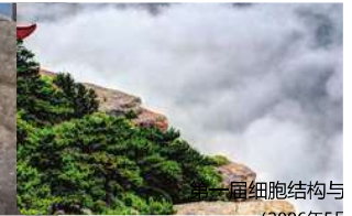
第一届细胞结构与功能的信号基础研讨会