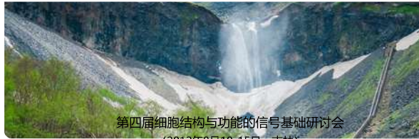
第四届细胞结构与功能的信号基础研讨会