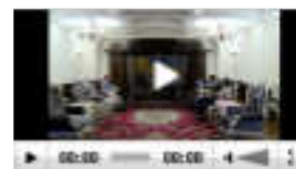
李蓬院士、林圣彩教授做客科学家...