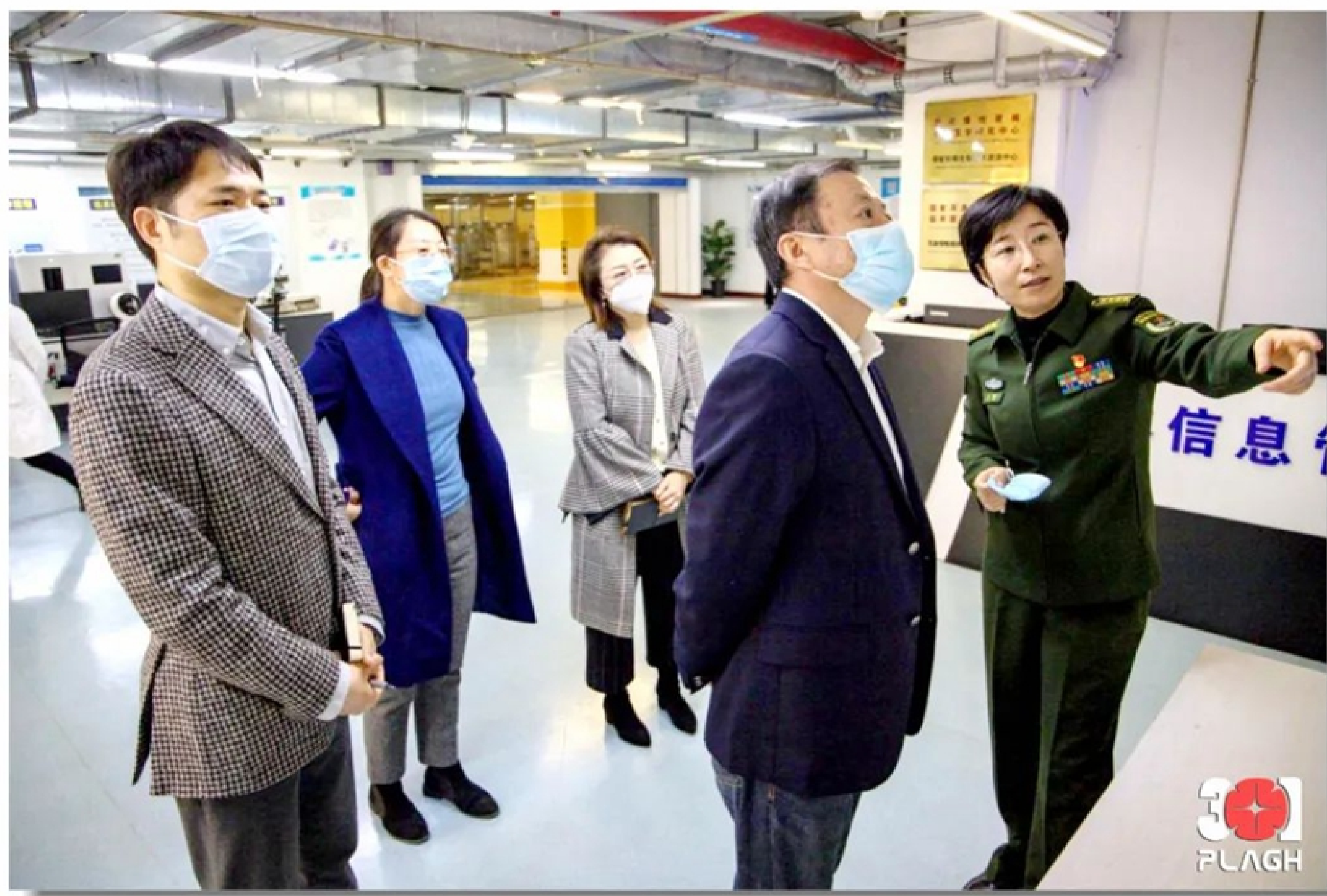
CNAS评审专家组在样本保藏库区进行评审

生物样本是临床医学、转化医学和基础研究所需的生物资源，也是探索疾病发生、诊断和治疗，以及药物研发等研究的重要基础，生物样本及其相关数据质量是生物样本库建设的核心目标。生物样本的采集和保藏机构（即生物样本库）则是生物样本质量保障的基础。