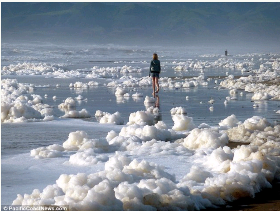
海滩变成泡泡浴场