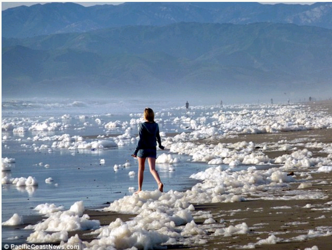
海滩变成泡泡浴场