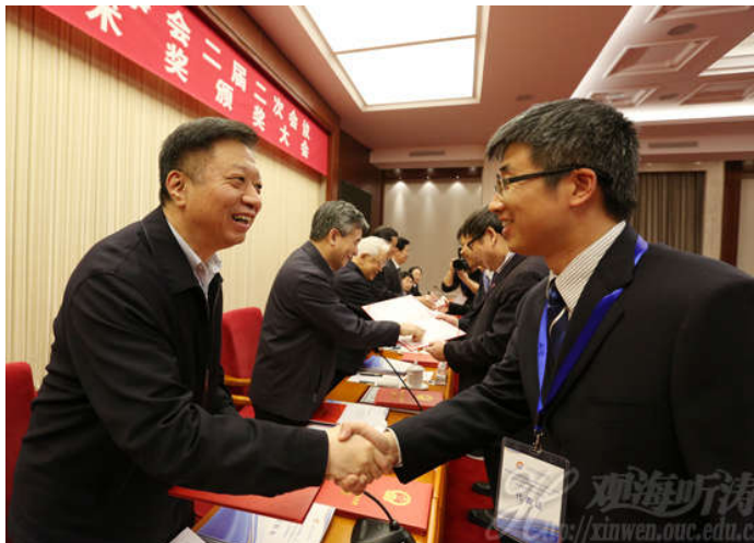
与会领导向获奖项目代表颁奖