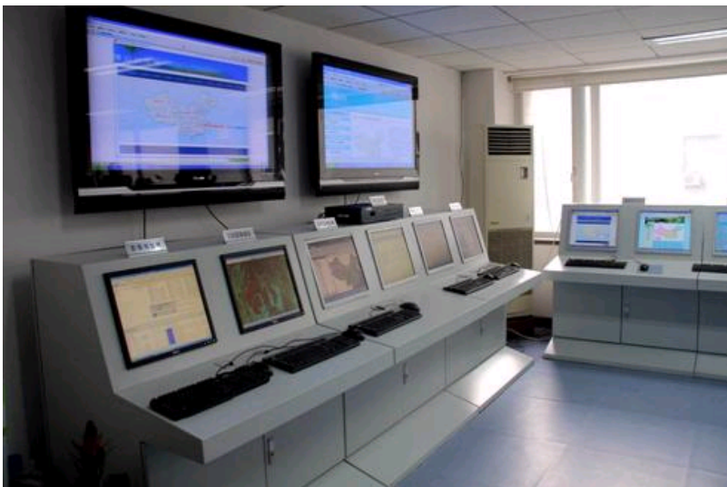
湖泊一流域数据集成与模拟系统平台

数据中心机房现拥有服务器7台、工作站4台、存储柜1个（38TB）、SGI大型计算机1台，已能够满足日常数据的管理、备份、维护和服务的基本需要；目前正在计划购买更高层次的存储和高性能计算设备。