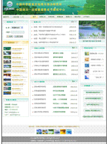
湖泊一流域数据库共享系统平台