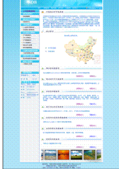
湖泊科学专业数据库