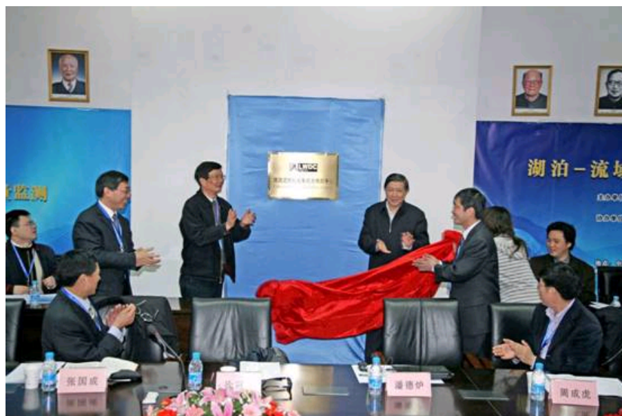
徐冠华院士和潘德炉院士为“湖泊—流域数据集成与模拟中心”揭牌

3月27日,“湖泊—流域数据集成与模拟中心”揭牌仪式在中科院南京地理与湖泊研究所隆重举行,科技部原部长徐冠华院士、国家海洋局第二海洋研究所潘德炉院士出席揭牌仪式并为中心揭牌。南京地理与湖泊研究所所长杨桂山研究员主持了该揭牌仪式。中心主任马荣华研究员向参加揭牌仪式的领导和专家详细介绍了数据中心的建设情况、科学定位和未来目标。