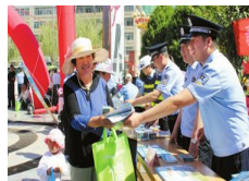
定西安定区多措并举狠抓禁