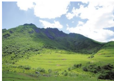
【西部地理】渭源双石门：