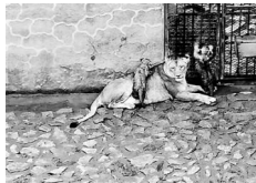
兰州动物园新添3只狮宝宝