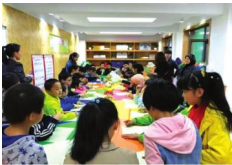
兰州白银路街道多措并举提升