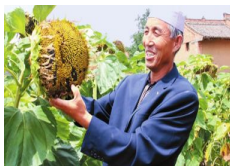
天水张家川县川王镇大力发