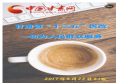
H5 | 甘肃省“十三五”医改：