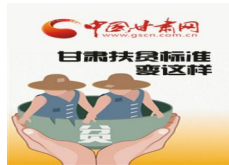
图解：速来围观！甘肃扶贫