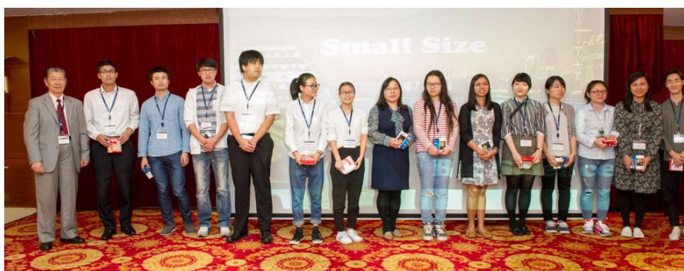
口头报告与学术海报获奖人员合影