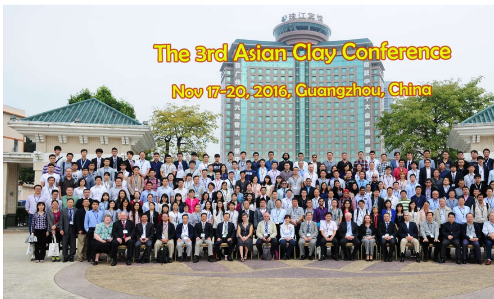
参会人员集体合影