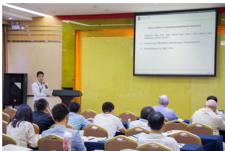
参会代表做分会场报告