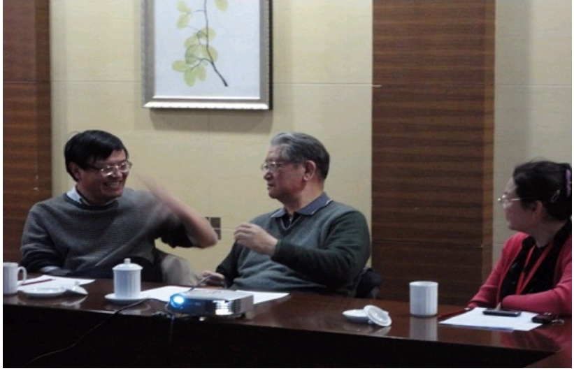
刘光鼎院士参加会议