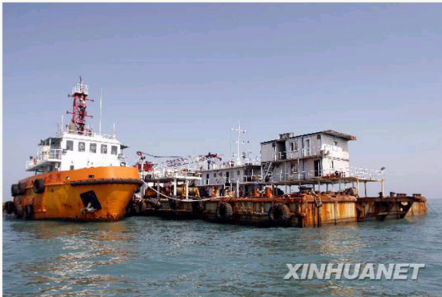
4月9日，由“南天顺”号打捞船和“德信”号拖轮组成的工程船组开始进行考古定位作业。