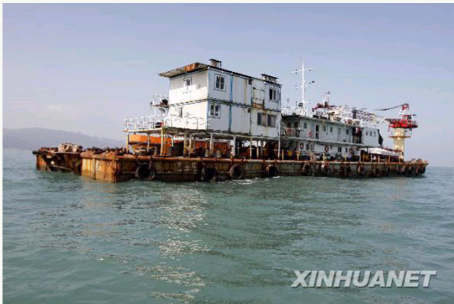
“南天顺”号打捞船在考古海域进行定位。