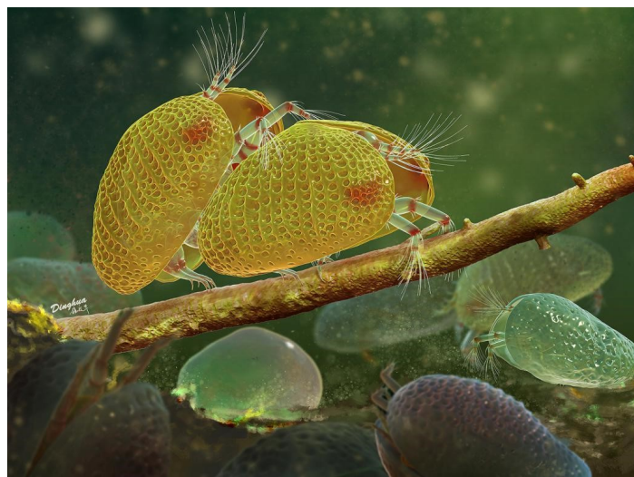
介形虫交配行为复原图（杨定华绘制）