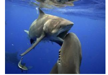
牛头鲨水下上演激烈搏