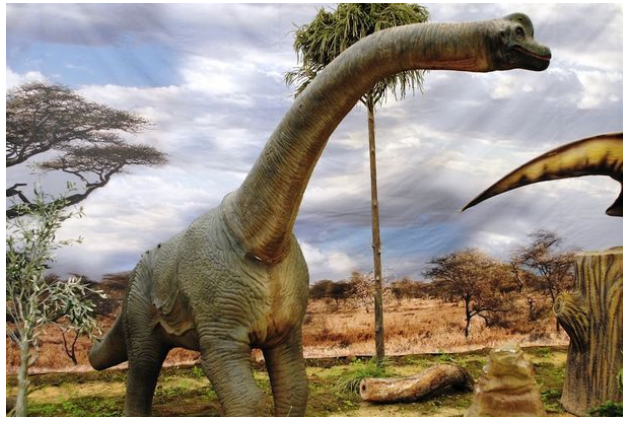
复原图：俄罗斯科学家在西利比亚发现新种恐龙“西伯利亚龙”