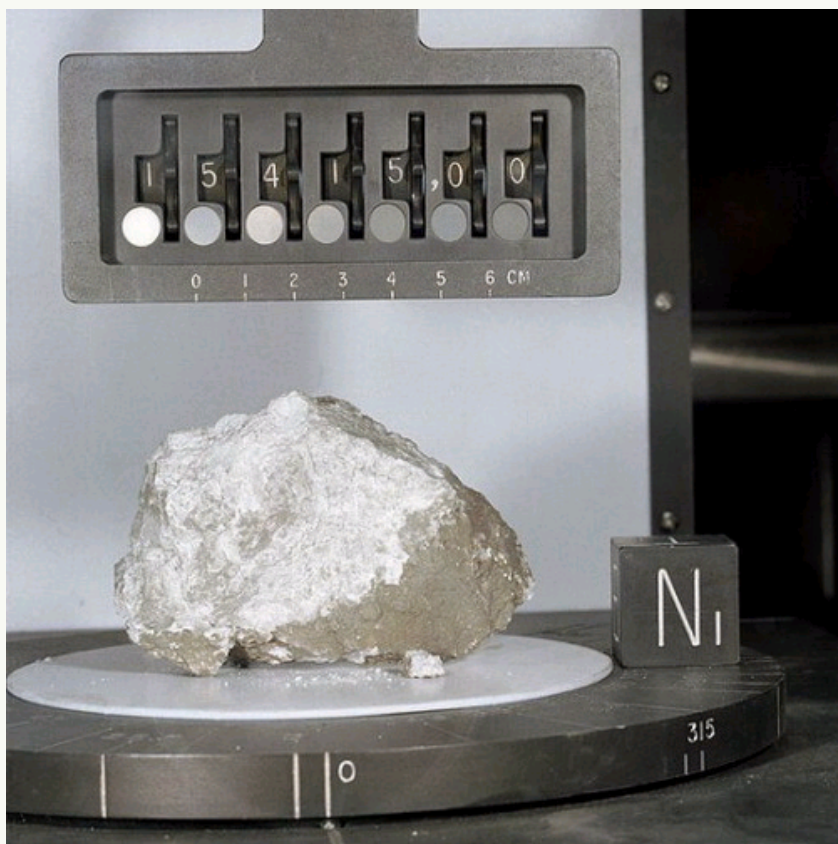
阿波罗15号宇航员采集回的月球岩石