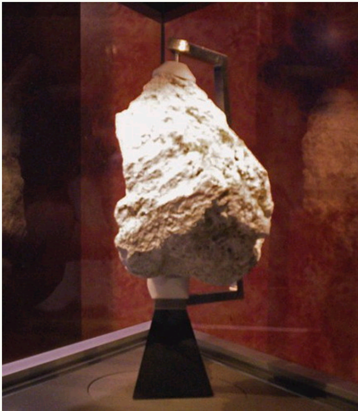
美国自然历史博物馆中展出的一块月球岩石，由阿波罗16号宇航员采集