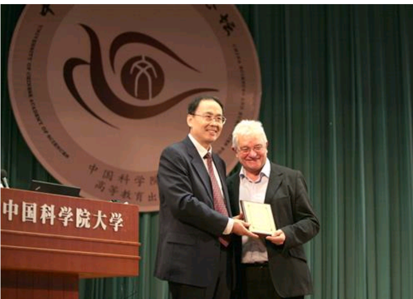
苏刚向Paul Nurse颁发荣誉教授聘书