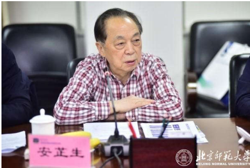
学术委员会主任安芷生院士主持会议