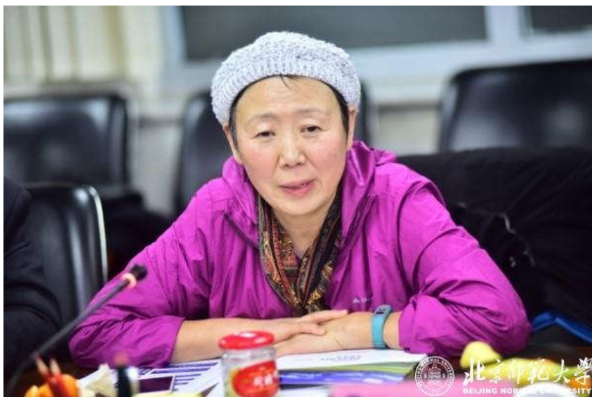
学术委员会委员周卫健院士发表意见