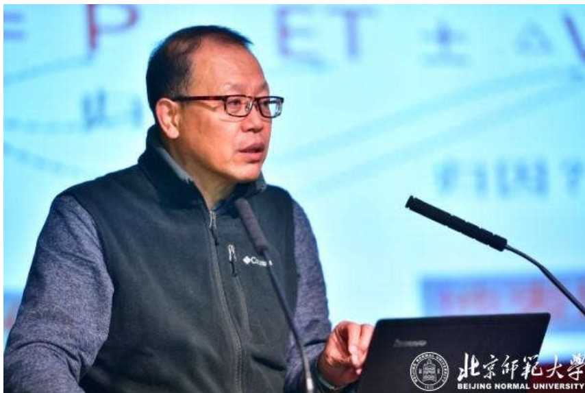
北京林业大学余新晓教授作特邀报告