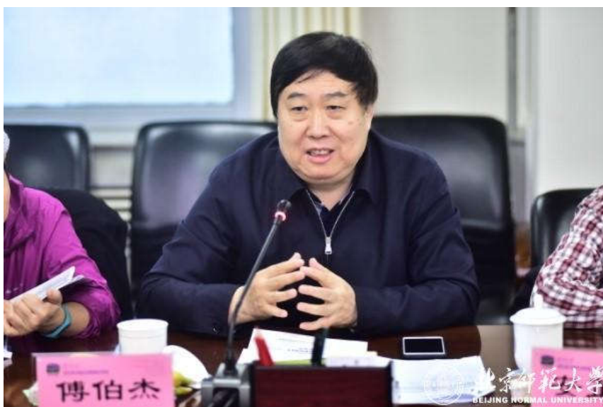
地理科学部部长傅伯杰院士发表意见