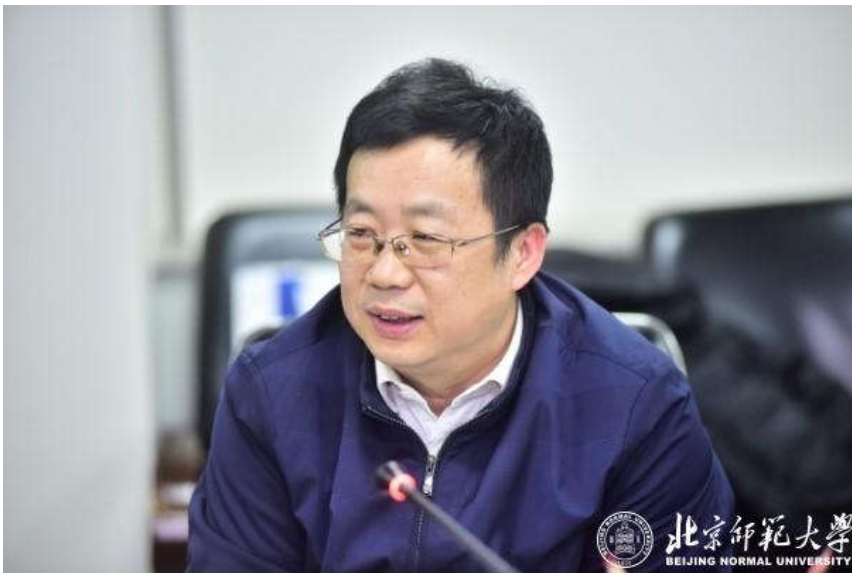
科技部基础研究司司长叶玉江司长发表讲话

会上，科技部基础研究司司长叶玉江、北师大科研院副院长徐洪及地理科学学部部长傅伯杰院士发表讲话。强调了地表过程与资源生态国家重点实验室在学校科研发展中的重要作用，充分肯定了学校、地理科学学部以及学术委员会对实验室的重视和支持，以及建设过程中取得的重要进展。并建议实验室尽快适应新时期国家科学研究的发展要求，推动更高层次、更深领域的长期合作与开放，注重重大关键技术创新和系统集成，进一步提升实验室的国际影响力和竞争力。