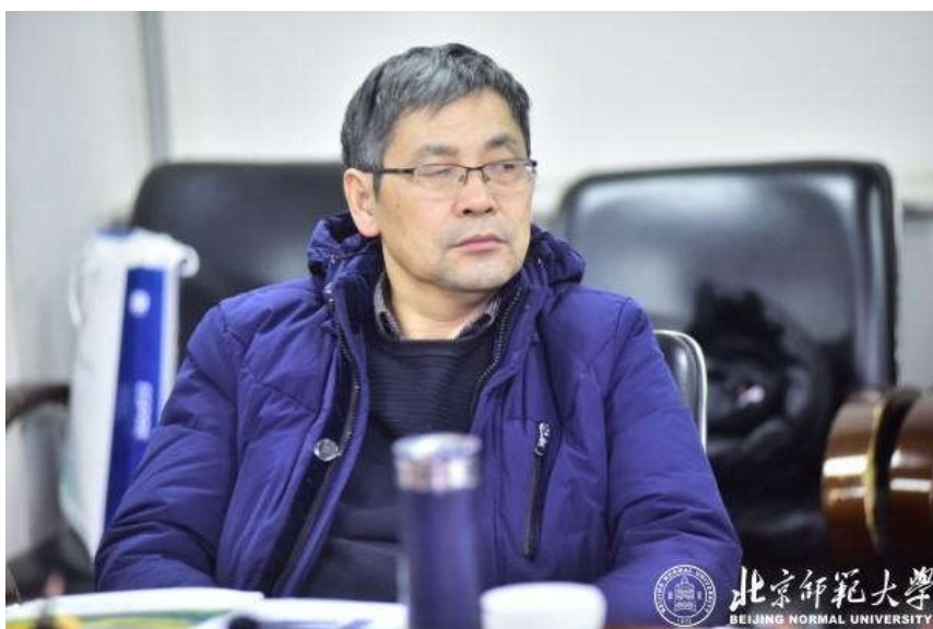
学术委员会委员邵明安院士发表意见

实验室工作汇报部分由学术委员会主任安芷生院士主持。实验室主任效存德教授向学术委员会汇报了2018年度实验室的人才队伍、科研工作、平台建设、合作交流等方面的情况，并提出了实验室发展过程中存在的问题和未来工作重点。