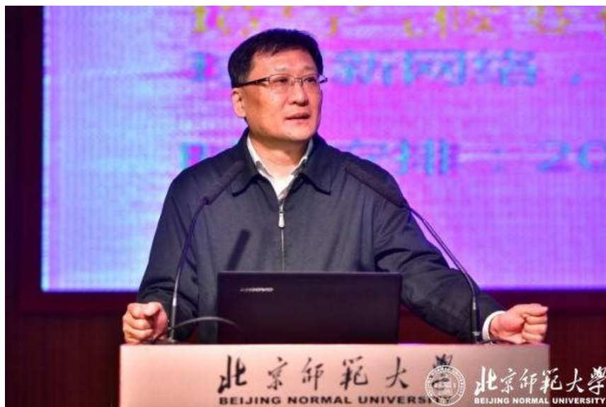
清华大学罗勇教授作特邀报告