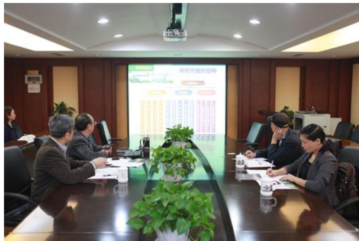
文安邦副所长介绍研究所情况