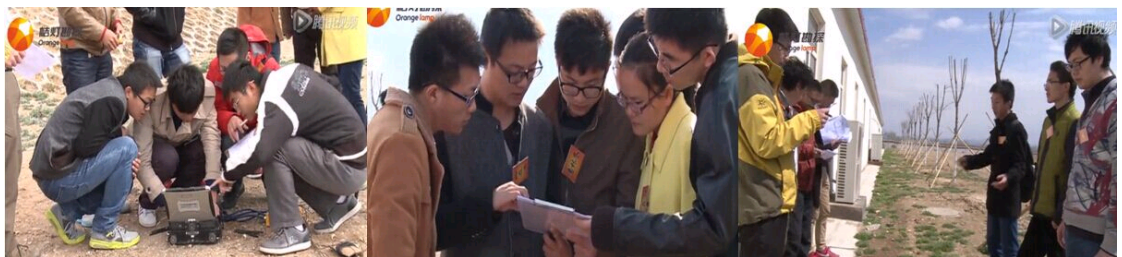
野外技能竞赛现场

12日早上8点30分，当人们还沉浸在周末的梦乡中的时候，九大高校的参赛队伍们已经来到武警警种学院西峰山实验场地开始了紧张的野外技能竞赛。九个队伍经过抽签分为三大组，分别进行了实验操作及结果报告。虽然有两个学校的学生都生病了，却仍然坚持参加比赛，这种精神实在令人敬佩。