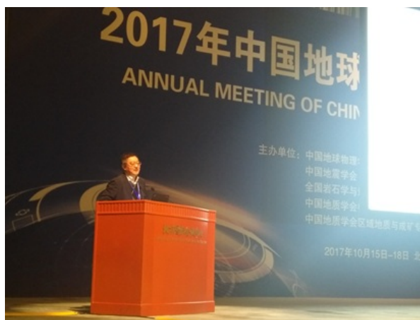
郭正堂院士作题为“亚生代环境演变及全球关联”的大会报告。