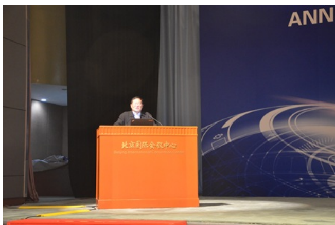
郑永飞院士作题为“板块俯冲带地球化学传输”大会报告。