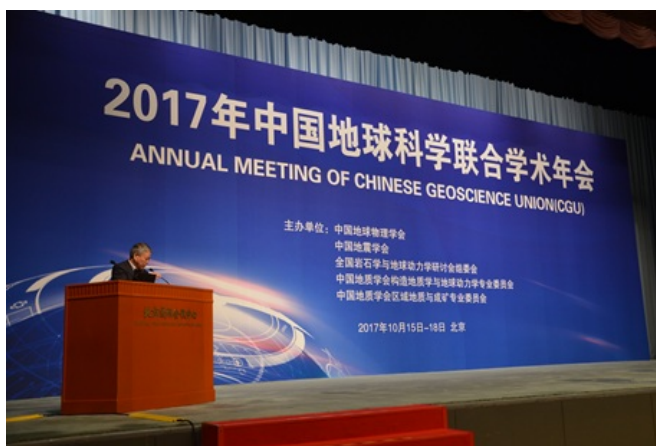
朱日祥院士宣布2016年年会研究生获奖论文名单。