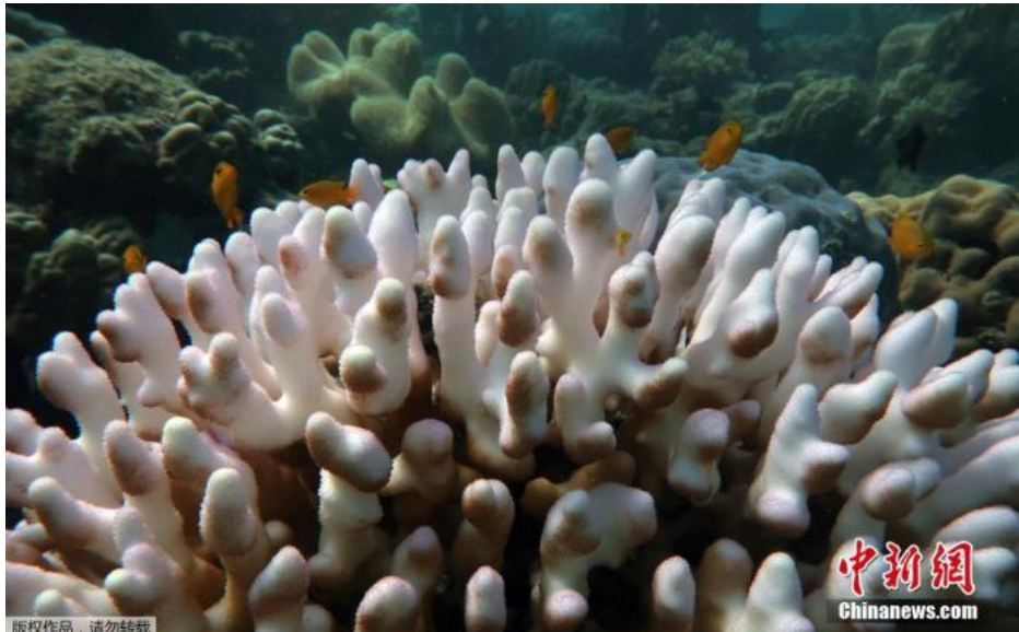
版权作品，请勿转载

因新冠疫情暴发，原本应该在2020年11月举行的格拉斯哥气候大会推迟到2021年。因此，格拉斯哥峰会提供了讨论增加碳减排量的平台，带来一种希望。