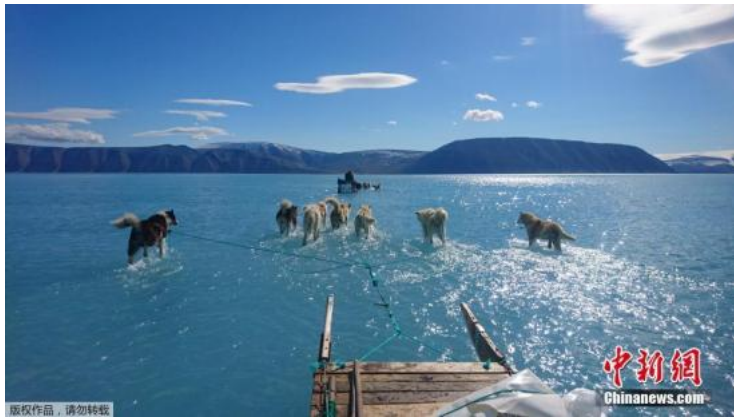
资料图：格陵兰岛西北部，雪橇狗穿过冰川融化后形成的湖水。