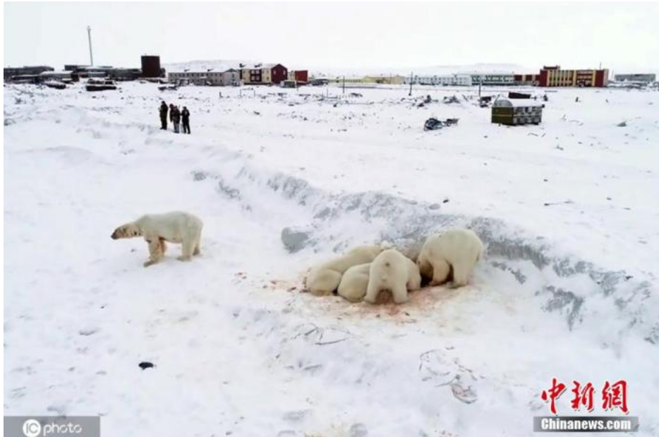
资料图：2019年12月9日，全球气候暖化对生态影响加剧，俄罗斯北部楚科奇自治区雷尔凯皮村附近出现60多只北极熊。由于全球变暖导致海面冰层变薄，北极熊不得不闯入人类村落觅食。

好消息是，全球利率在零上下浮动，甚至探入负域。政府刺激方案的成本因此前所未有的低，也创造了一个前所未有的“除旧纳新”的重建机会。