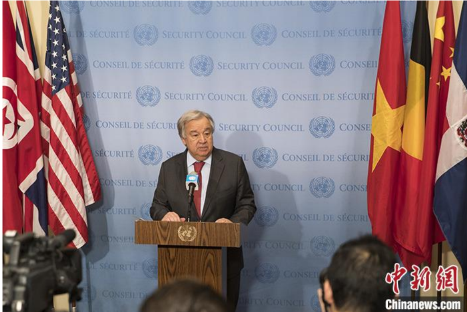
资料图：联合国秘书长古特雷斯。

中新网1月3日电 据英国广播公司(BBC)2日报道，2021年在全球的欢呼和期待中到来。新的一年，气候变化、地球变暖的话题，将成为热门议题。联合国秘书长古特雷斯告诉BBC首席环境事务记者贾斯廷·罗拉特，他认为气候变化持久战胜负的转折点，就在今年。对此，BBC刊文列出2021年气候变化议题可能出现转机的五大原因。