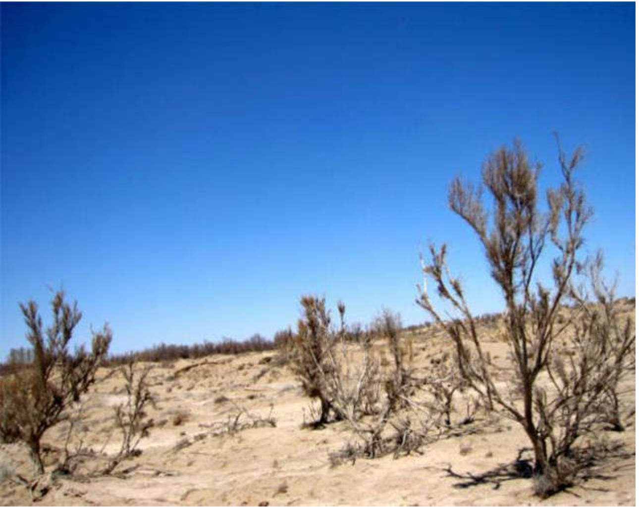
干旱半干旱区地貌（2010年4月拍摄于甘肃民勤）