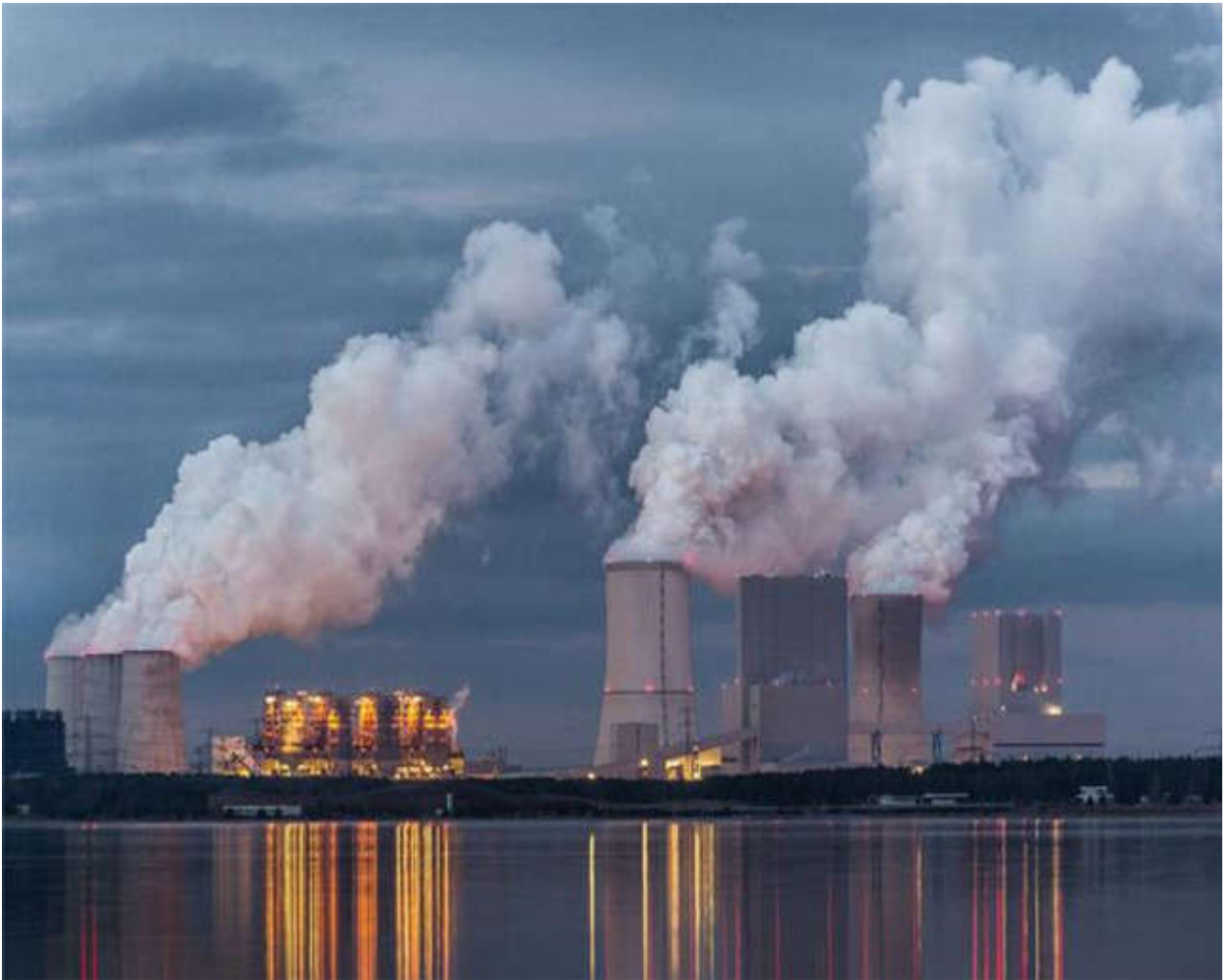
湿润发达地区工业排放

干旱半干旱区占全球陆地面积42%，养育着世界38%的人口，且主要分布于贫穷落后的发展中国家，而发达国家多分布于湿润区。以上CO 2 排放与升温速率在空间分布上显著的非对称性表明干旱半干旱区的增暖很大程度上是湿润区发达国家的温室气体排放造成的。黄建平团队2016年发表于《Nature Climate Change》上的研究成果曾表明未来全球干旱半干旱区将加速扩张，气候变暖、干旱加剧和人口增长的共同作用将增大发展中国家发生荒漠化的风险，而本研究是在之前研究基础上的又一重要进展。该系列研究表明国际社会应重视气候变化灾害和气候变暖责任在不同地区之间的不平等性，加强对贫困落后的干旱半干旱区的关注；发达国家有义务承担更多责任，应兑现承诺，切实采取履约行动，推动这一协定的实施。