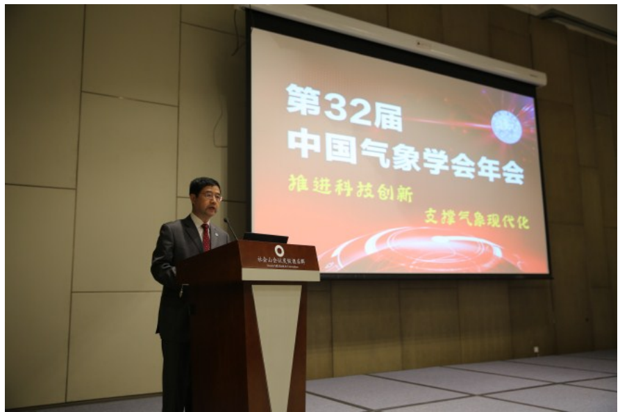
沈晓农副局长讲话

“希望气象科技工作者围绕国家科技创新发展需求，加强学术交流，注重科技创新；发挥学会优势，学以致用、研以致用，积极推动科技成果的多方式转化和融入气象业务服务；身体力行，营造良好的科学文化氛围。”中国气象局副局长沈晓农说。