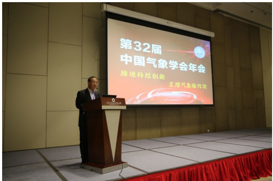
王会军理事长主持开幕式

2015年10月14日，以“参与、共享、合作、创新”为宗旨，“推进科技创新、支撑气象现代化”为主题的第32届中国气象学会年会在天津隆重召开。年会开幕式由中国气象学会理事长王会军院士主持，中国气象局党组成员、副局长沈晓农，天津市政府副秘书长朱清相应邀出席大会并致辞，年会还特别邀请了中国气象局原局长、中国气象学会名誉理事长秦大河院士，中国工程院原副院长、国家气候变化专家委员会主任杜祥琬院士，中国工程院丁一汇院士、天津市科协党组书记杨鑫传、天津市科协副主席白景美、天津市气象局局长权循刚等专家、领导出席了开幕式。