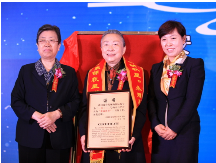
朱丽兰、王莉霞向张锦秋颁发“张锦秋星”铜匾