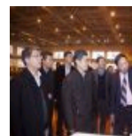
海岸和近海工程实验室接受评估“