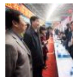
学校2013届毕业生供需见面会举行