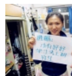
【毕业季】大学四憾的那些事