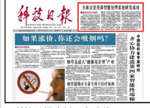
科技日报头版：全球首...