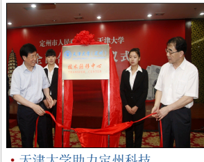
天津大学助力定州科技...