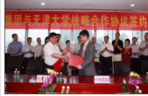
天津大学与中科招商商签...