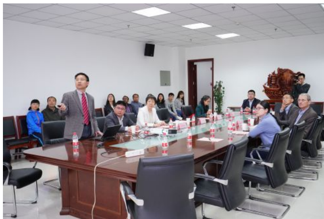
在化材学院开展学术交流