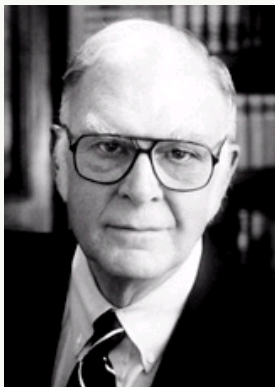
舍伍德·罗兰

据国外媒体报道, 1995年诺贝尔化学奖得主舍伍德·罗兰 (Sherwood Rowland) 因帕金森病于3月10日逝世, 享年84岁。