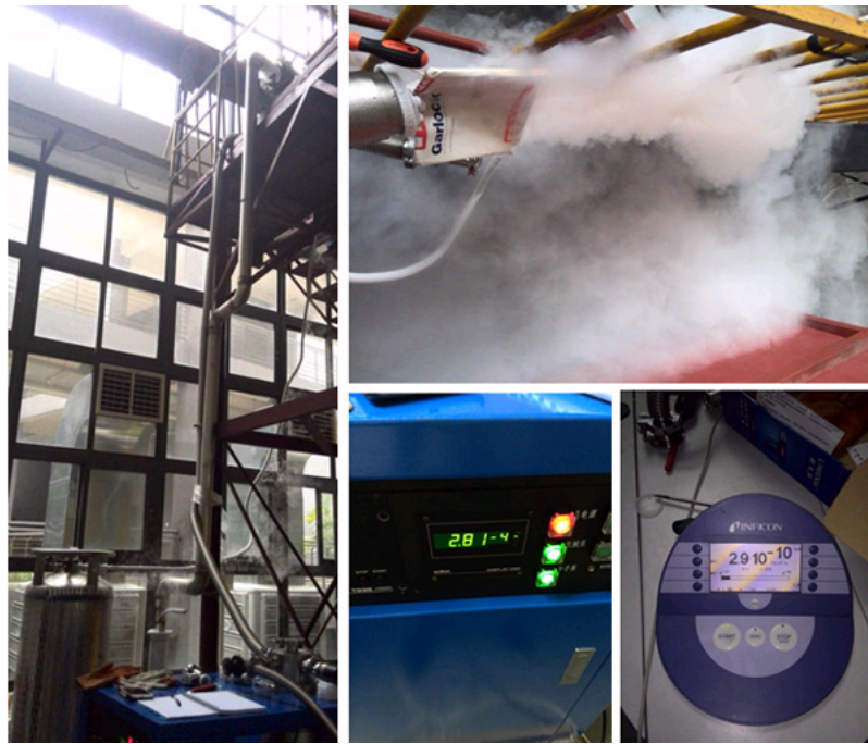
慢化器低温性能测试复验