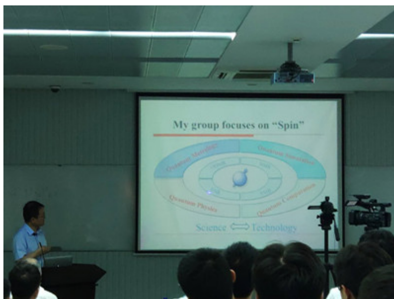
杜江峰院士做报告