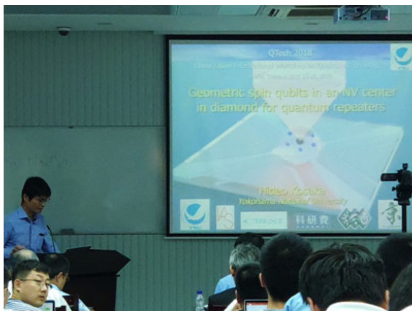
日本横滨国立大学教授小坂英男 (Kosaka Hideo) 做报告