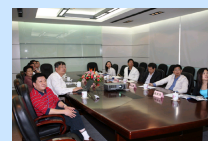
市科教党委领导来我所