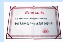
协力创新求进步——我