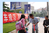
我做一次文明交通志愿