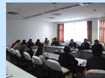
二室春节前后开展基金