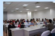
扎实推进业务培训 我