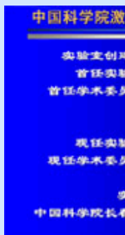
+中国科学院激发态物理重点实验室