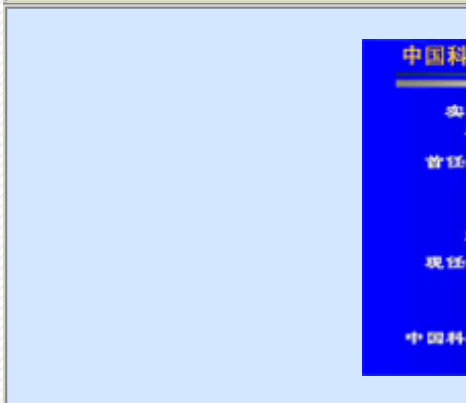
+中国科学院激发态物理重点实验室