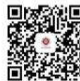
【 微信公众号 】

地 址: 北京市海淀区北京大学理科 1号楼 邮 编: 100871 联系电话 : 010-62751804 邮 箱 : mathweb@math.pku.edu.cn