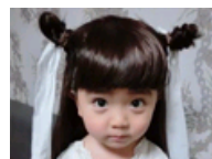
男版小龙女萌萌哒